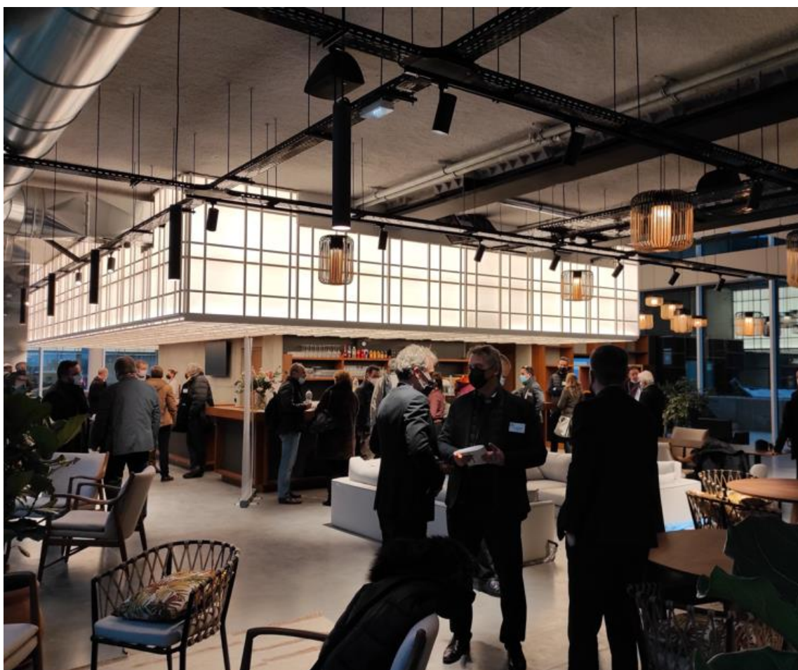
「LUMEN」1 階 アメニティエリア 2022 年 1 月時点

ホームページ : https://www.clusterlumiere.com/